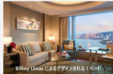
Bilkey Llinas によるデザインされる1ベッド