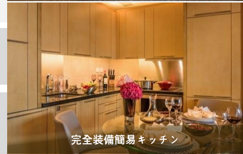
完全装備簡易キッチン