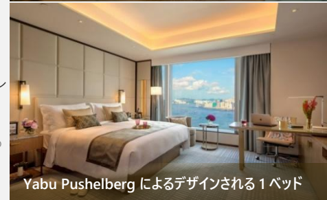
Yabu Pushelberg によるデザインされる1ベッド