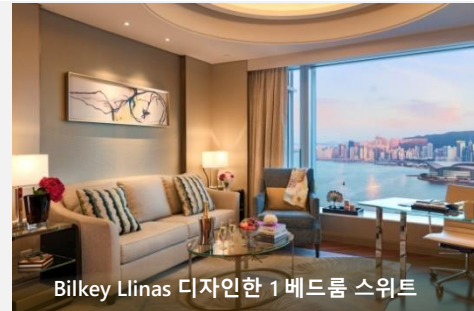
Bilkey Llinas 디자인한 1 베드룸 스위트