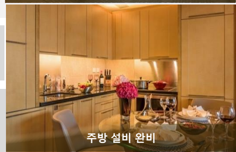
주방 설비 완비