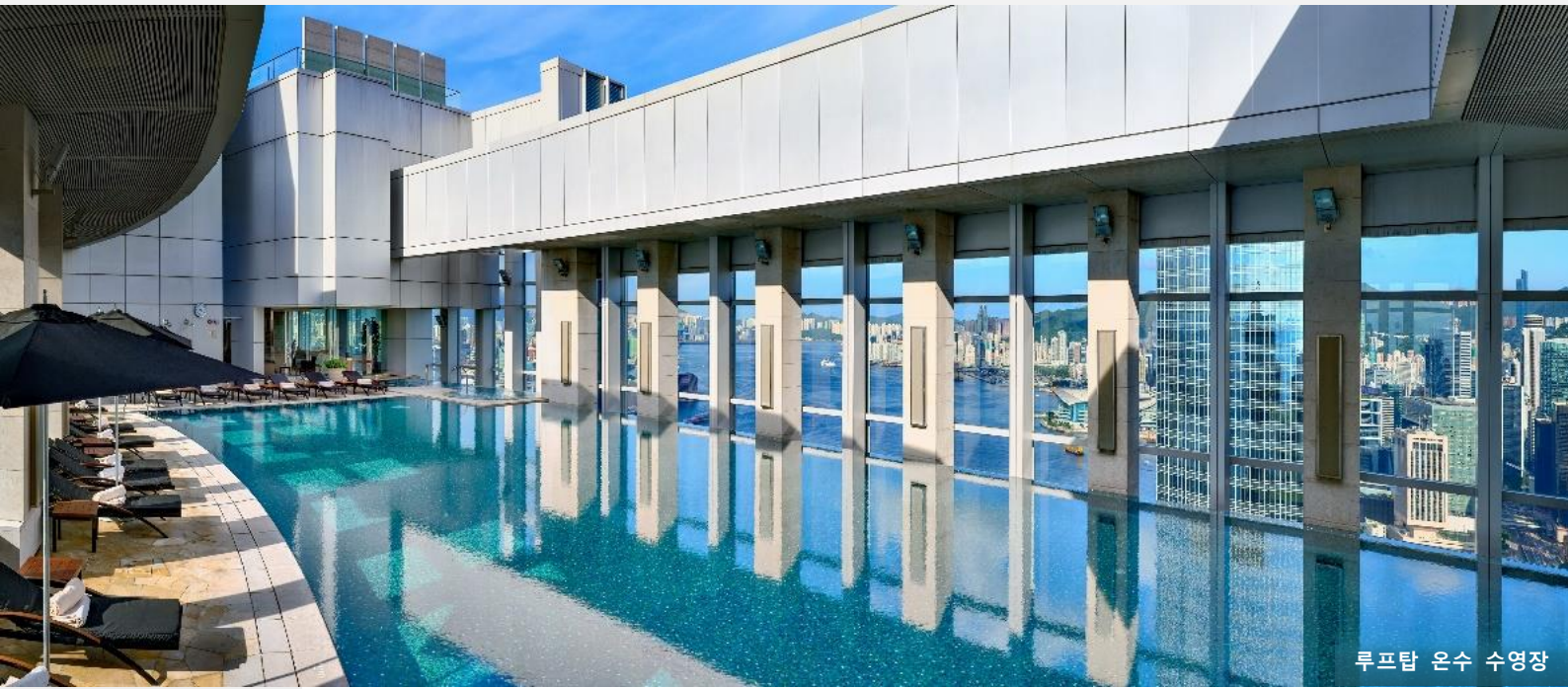
루프탑 온수 수영장