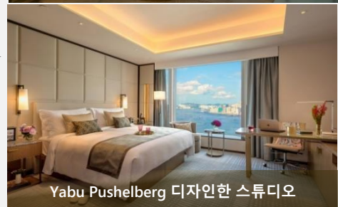
Yabu Pushelberg 디자인한 스튜디오